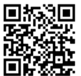
Stiftung Kinder- und Jugendhospiz Regenbogenland

Wir bedanken uns ganz herzlich bei allen Unterstützern, Helfern und dem Druckstudio!